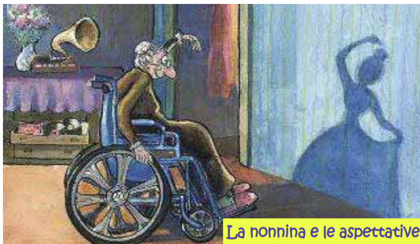
La nonnina e le aspettative